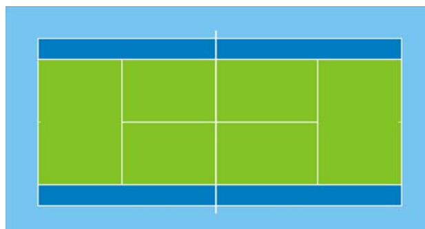
Spielfeldgröße: 23,77 m x 8,23 m (Einzel+Doppel)